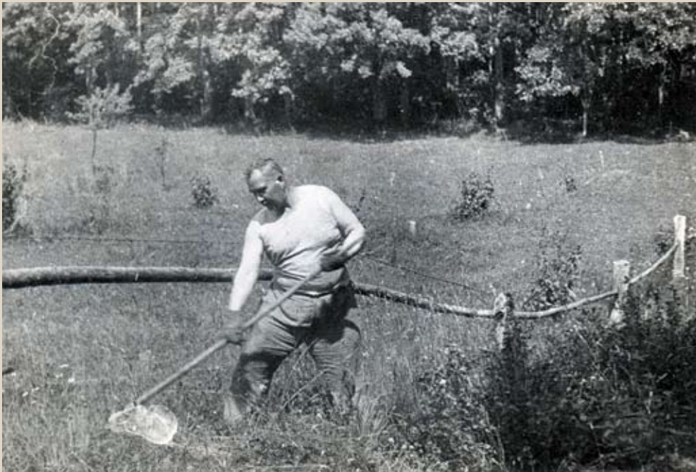
Косить траву — и работа, и удовольствие!